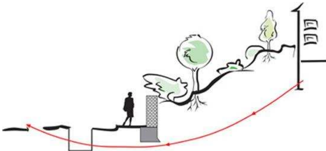
Abb. 3: Hausanschluss unter Mauer durch

Kontaktieren Sie uns einfach für Ihre individuelle Beratung!